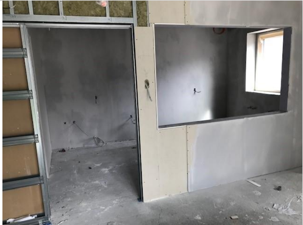
Indgang med skydedør til venstre og barvindue til højre