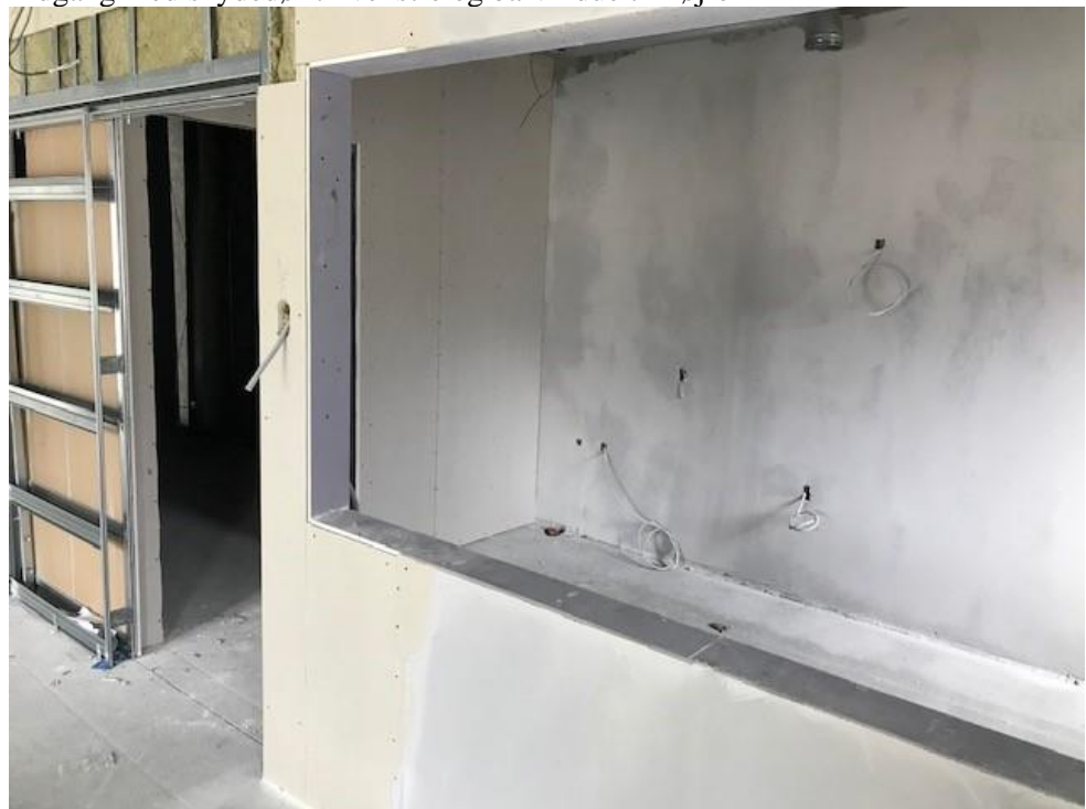
Bagved til venstre kan man se indgangen til et tilstødende lokale, hvor opvask mv. kan foregå

1.17 Hvad er forskellen på de to boligtyper?